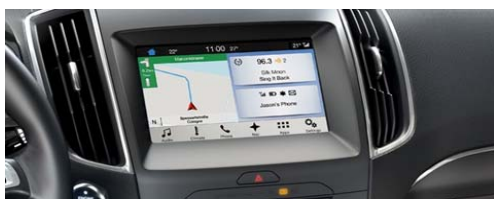
Navigacijski sistem Ford SYNC 3 z zaslonom na dotik