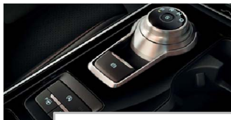
Samodejni 8-stopenjski menjalnik