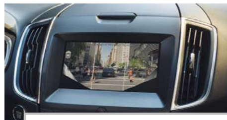
Prednja širokokotna kamera