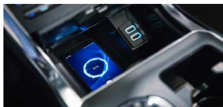
Blazinica za brezžično polnjenje telefona