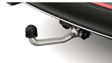
Snemljiva vlečna kljuka