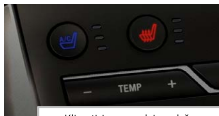
Klimatizirana prednja sedeža